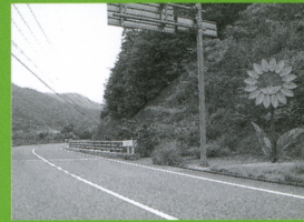
芦田湖オートキャンプ場(八田原ダム)近くにあるジャンボひまわりのカーブミラー。この向こうに世羅高原ふれあいロードの入口がある。 マップP7-A

A まず、かん太くんありがとう! よくぞ見つけてくれました。このジャンボひまわり、じつはカーブミラーが変身したもののなのです。よく見ると、花の中央のまあるい部分がミラーになっているのです。誕生したのは今から13年も前、八田原大橋完成の頃。世羅方面への玄関口として、ちよūdōこの地点が世羅高原ふれあいロードの入口近くにもなるので、そのシンボルとしてお目見えしたのではないかと思えます。みはらっせ大好きママさん、この夏はぜひ家族でキャンプ、農園めぐりをお楽しみください。それと、パパにもよろしく! (編集室: いにしへのキャンブ男)