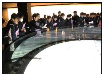
広島平和記念資料館

1月17日（水）に、1年生は、広島市へ「平和学習」に行きました。平和記念公園のほか、広島城、ひろしま美術館を訪れ、日々の学校とはまた違った“学び”ができました。平和記念資料館で真剣に資料を見る姿や、美術館で心穏やかに絵を鑑賞する姿がありました。