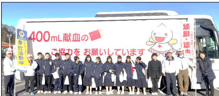
三原ライオンズクラブの方々と献血バスの前で記念撮影

1月21日（日）に、マックスバリュート本郷店の駐車場で、献血の呼びかけをするボランティア活動に本中生12名が参加しました。広島県赤十字血液センターからの報告では、献血者数は73名で、普段より多くの献血があり、大変喜ばれていました。ありがとうございました。