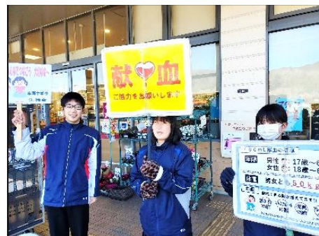
献血の呼びかけのようす