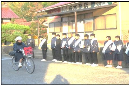
立候補者の朝の挨拶運動

3年生のみなさん、学校行事や委員会活動、部活動など様々な場面で活躍してくれてありがとうございました。これからの1・2年生の頑張りを温かく見守ってあげてください。