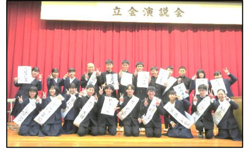
演説会終了後の全員写真撮影。 みんないい笑顔です！