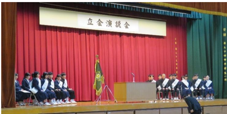
体育館での立会演説会の様子

12月7日(木)に、体育館で、新しい 生徒会役員を決める生徒会選挙の立会演説 会・投票が行われました。結果は、次の通 りです。選挙管理委員会のみなさん、あ りがとうございました。