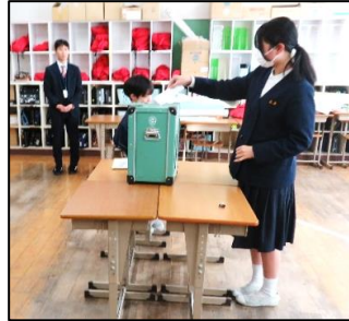
本物の投票箱を使って投票しました。