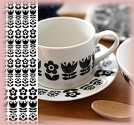
写真は、イメージです