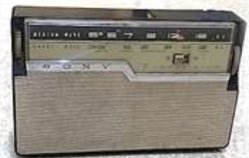
トランジスタラジオ

トランジスタは、主に材質がシリコンなどでできている「半導体」からなる部品で、現在のスマホや家電、パソコンなどあらゆる電化製品に使われているIC(集積回路)は、トランジスタ等が集まってできています。