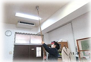
機 器 点 検