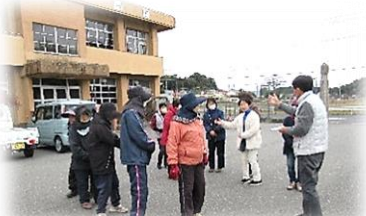
避 難 誘 導