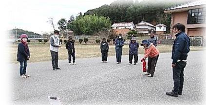
消 火 訓 練