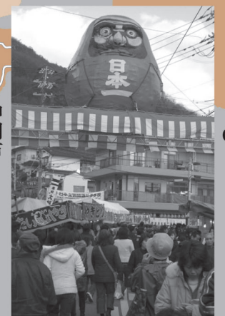
神明市 毎年2月2日曜日に行われる、別名「だるま市」。ダルマや植木などの露店や多くの人で賑う。