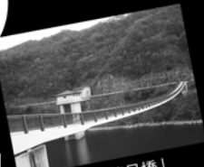
確かに長い「夢吊橋」