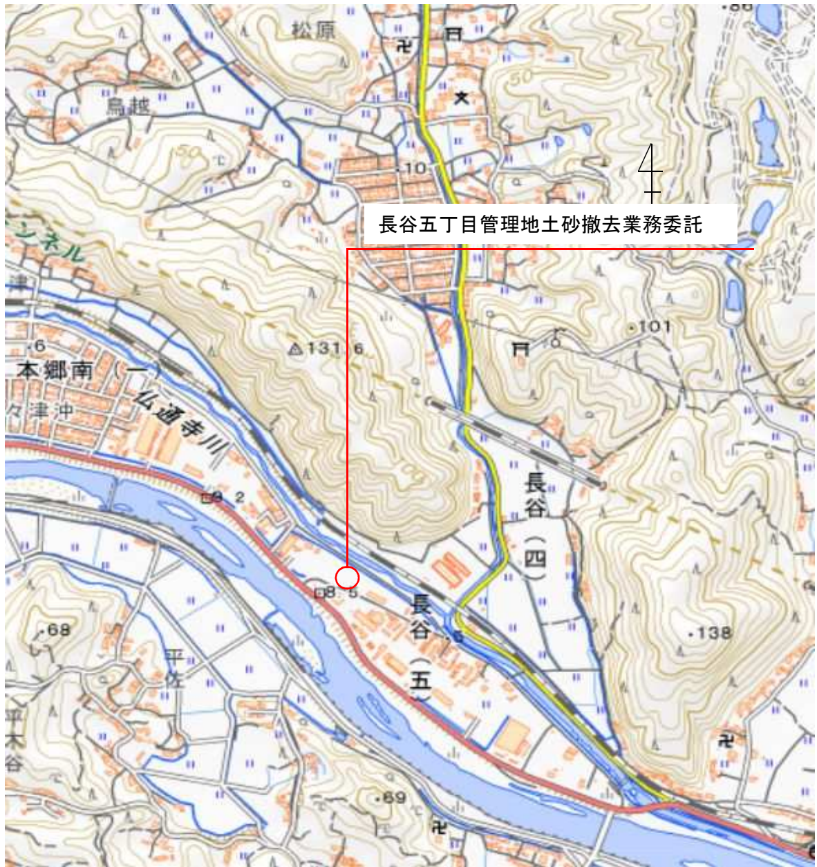
国土地理院地図引用