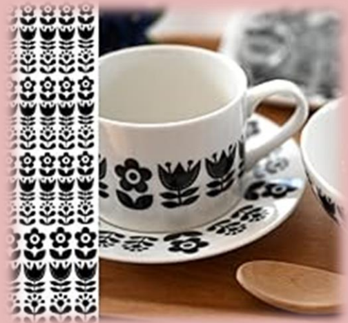
写真は、イメージです