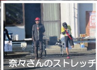
奈々さんのストレッチ