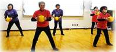
3Bわくわく・そらいろ合同チーム