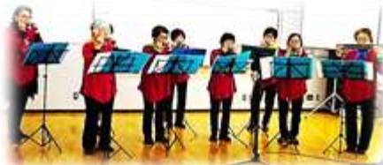
なかよしハーモニー