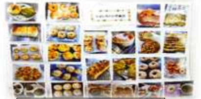
なないろパン倶楽部