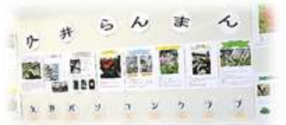
久井パソコンクラブ