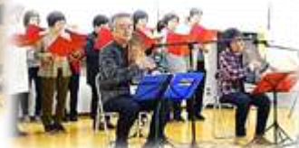
オートハープと歌おう会