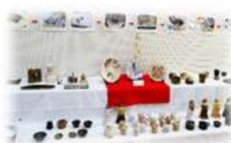
陶芸にチャレンジ