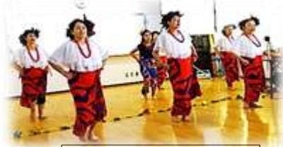
カブア・ロケ・ブルースカイ井