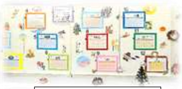
はじめてのパソコン