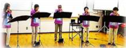
久井オカリナ教室