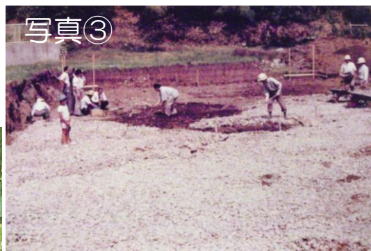
写真② 矢じり 3点 写真③ 昭和 52（1977）年 遺跡の調査風景