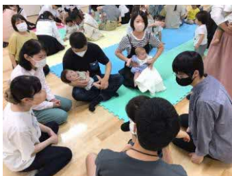
あかちゃんスタッフと学生の交流の様子