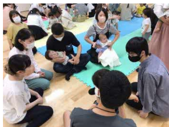
あかちゃんスタッフと学生の交流の様子