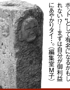
八十八ヶ所入口にある石の道標。指型の矢印にかわいいお地蔵さんの顔も。

●春をむかえ、これから春のドライブシーズン! みはらしせ弁持って、観光農園めぐり。のどが渇いたらちよっと寄り道して美味いお水でのどを潤して下さいね。(三原担当 丁川)