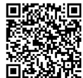
▲ 電子申請システム