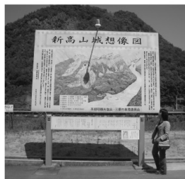
沼田川をはさんで左が新高山、右が高山。