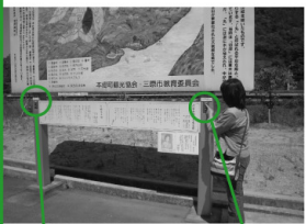
新高山の音声ガイド 名水音頭

で、これで驚いてはいけない。 なんと、ボタンを押すと名水 音頭が流れてくるのだ!!また 反対側には新高山城跡の音 声ガイドもあり、カラクリ両面 看板となっている。