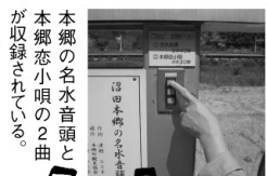
本郷の名水音頭と 本郷恋小唄の2曲 が収録されている。