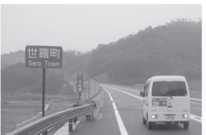
尾道~世羅間では心が和む里山風景が楽しめる。尾道北IC付近の高架橋は圧巻。

中国横断自動車道 世羅~尾道間が いよいよ開通!! 全通すれば尾道市から島根県松江市まで約150分(137分)で行くことができる「中国横断自動車道尾道松江線」のその一部分(「尾道JCT」~「世羅IC」)約10分短縮・通行料無料(但し山陽自動車道経由の場合には料金有り)なので、通勤やおでかけなど生活道として活用したい。 開通式概要 ■日時/11月27日(土) 11時45分 ■会場/世羅町川尻(世羅IC付近 ※テレポートのみ) ■開通式典(尾道市御調町)後、世羅IC付近でテレポートを行います。一般交通開始は同日15時から。▼世羅町建設課 ☎0847・22・5309