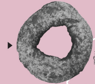
豆乳ドーナツ 200円 手づくりドーナツ 1コ60円