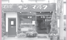
店内には米粉を使ったロールケーキなど地産地消の商品が数多く並ぶ。