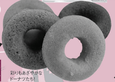
彩りもあざやかなドーナツたち! 贈り物にも喜ばれそう。