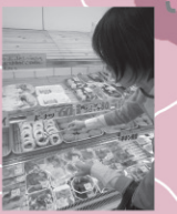
自分で好きな数を取るシステム。電話予約が確実だ。