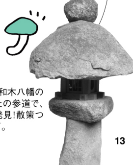
きのご灯籠 市天然記念物「和木八幡のスキ」がある神社の参道で、おもしろい燈籠を発見! 散策ついでに寄ってみて。