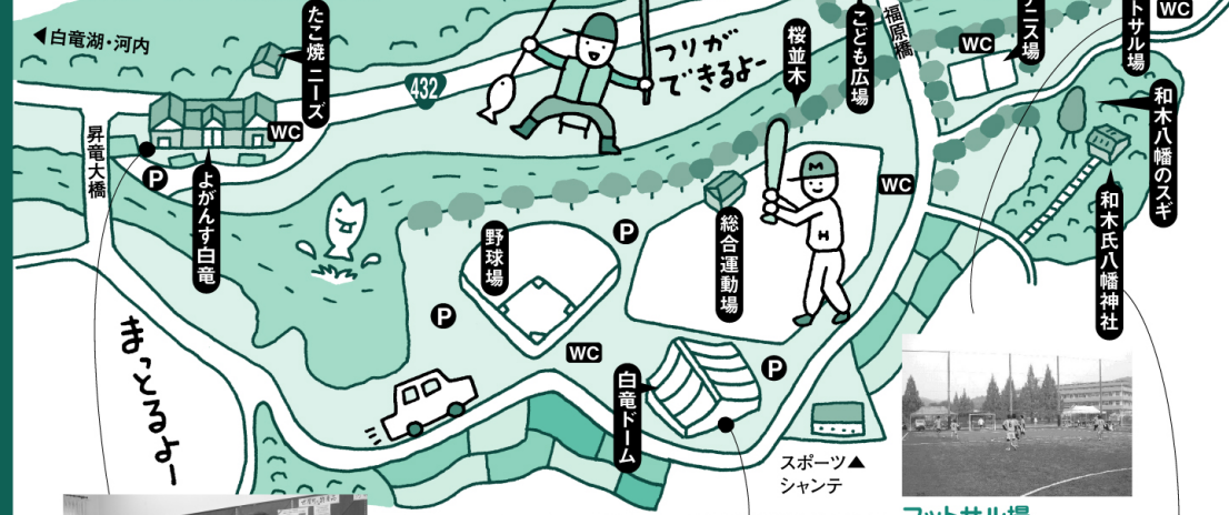
フットサル場 人気の球技「フットサル」が本格的な人口芝でプレーできる

三原市大和町和木 ☎090・7503・7472 営業 10:30~18:00 休月、第1.3土曜日