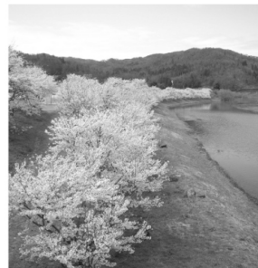
白竜湖の桜並木 白竜湖の湖畔沿い、見事な桜並木が続く。シーズン中にはライトアップの予定も。幻想的な風景は一見の価値あり。