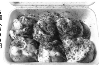
ニースのたこ焼 三原ではちょっと珍しい大阪風のたこ焼。生地がトロツとした、なんとも言えない食感にリピート客も多い。ダシ・塩など選べるソースが嬉しい。

三原市大和町和木 ☎090・7503・7472 営業 10:30~18:00 休月、第1.3土曜日