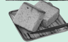
カステラは、よもぎの緑色と独特の香りがしました。

3月16日に「世羅の特産品を使った活動を考えよう」という集まりに参加してきました。そのイベントの中で新お土産物の試食会が!「よもぎ入りカステラ」に「アスパラもち」…まだまだ美味しいものがたくさんあってお腹いっぱい。早くみんなに食べてもらいたいなあ。 取材:勝見特派員(世羅町)