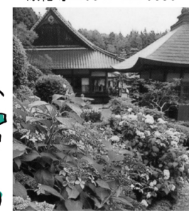
色とりどり、大輪のあじさいが咲いている。

■会場／康徳寺 ■世羅ICから15分、三原久井ICから20分 ■「世羅のあじさい寺」として知られ、境内とその周辺に約4,000株の様々なアジサイが咲きます。また、6月26日には「花供養会」も開かれます ▼康徳寺 ☎0847・22・0635