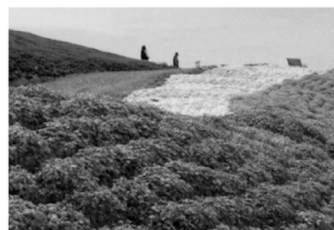
色とりどりの芝桜が美しい。

■時間／9時～17時 ■料金／大人700円、子ども300円 ※料金は変更する場合があります