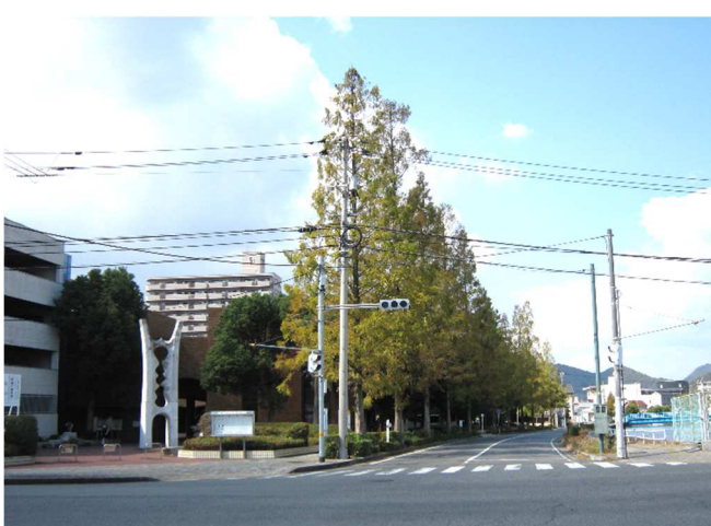
紅葉間近!!西野川沿い(三原リージョンプラザ側)のメタセコイア並木

メタセコイアの花言葉は、「平和」とのこと。昨今の世界情勢に、この並木に祈りを捧げずにはいられません。