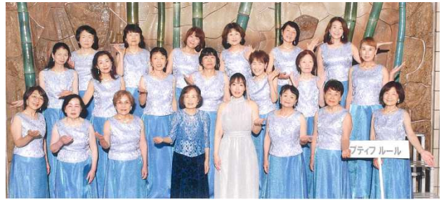
第46回全日本おかあさんコーラス中国支部広島大会にて