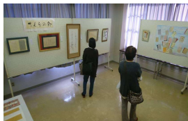
さくらの会 かな作品展示 センター主催講座