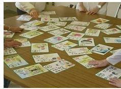
三原地区更生保護女性会 カルタ大会

子どもたちの健全育成、 犯罪予防、更生を願い 絵とことばを自作され たカルタ。 国際交流、子どもたち とふれあうカルタ取り 大会が開かれました。