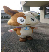
行政相談の マスコット (キクーン)登場