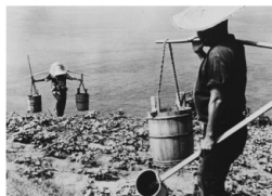
「宿祿島」がロケ地になった映画「裸の島」

■会場／リージョンプラザ文化ホール ■JR三原駅から徒歩15分 ■新藤兼人監督作品の上映。3日(土)は3作品無料。4日(日)は最新作「1枚のハガキ」を上映(有料) ■10時30分上映(10時開場) ■4日:「1枚のハガキ」1,000円、高校生以下無料(予定) ▼三原市民映画祭開催実行委員会 ☎0848・67・6014