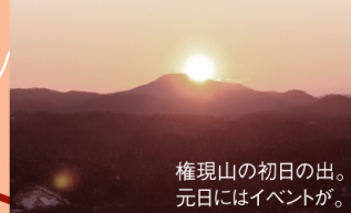
権現山の初日の出。元日にはイベントが。P9にイベント詳細あり