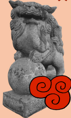
〔世羅〕賀茂東・厳島神社 目ギョロ狛犬