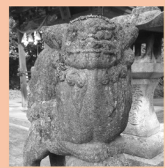
〔世羅〕地頭八幡神社 マッスル狛犬