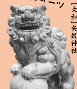
〔三原〕瀧宮神社 ダブル玉持ち

玉のり型の芸術作品!鈴に御網まで付いている!!4体いるうちの1つに、口の中に玉を持った狛犬もいた。