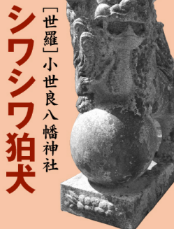
〔世羅〕小世良八幡神社 シワシワ狛犬