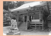
世羅町の宗社とも言える神社。神殿内には重要文化財の木彫狛犬がいる。