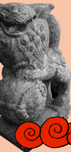
〔世羅〕早立八幡神社 鈴玉のり狛犬