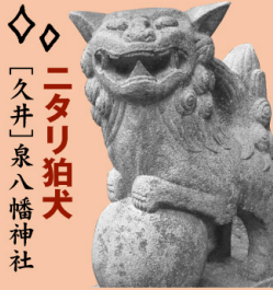
〔久井〕泉八幡神社 ニタリ狛犬

まるで柴犬を思わせるプチ狛犬。キョトンとした表情がいい。ここには大・小2対の狛犬がいる。