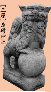
〔三原〕系碕神社 クルクルマフラー