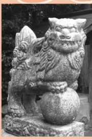
〔大和〕大草八幡神社 豆柴狛犬

まるで柴犬を思わせるプチ狛犬。キョトンとした表情がいい。ここには大・小2対の狛犬がいる。