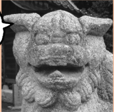
〔世羅〕神原八幡神社 布袋さん狛犬