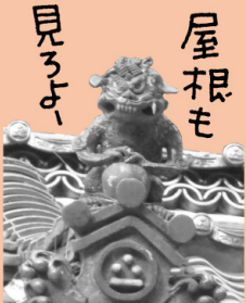
〔世羅〕枯木八幡神社 屋根の上の狛犬