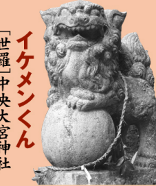
〔世羅〕中央大宮神社 イケメンくん

地元の学生がトレーニングにも利用する急な階段の先にある神社。疲れたうに怒られる…つらい。