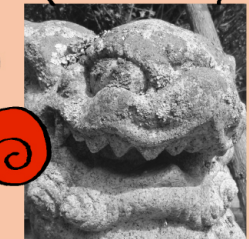
〔世羅〕早立八幡神社 鈴玉のり狛犬

玉のり型の芸術作品!鈴に御網まで付いている!!4体いるうちの1つに、口の中に玉を持った狛犬もいた。