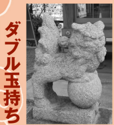
〔三原〕瀧宮神社 ダブル玉持ち