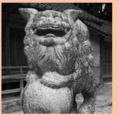
〔世羅〕徳市八幡神社 たそがれ狛犬