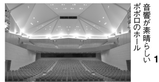
音響が素晴らしい ポポロのホール

ポポロ恒例の広響コンサート。クラシックの名曲を演奏。指揮者は元N響コンサートマスター徳永二男■15時開演(14時30分開場) ■全席指定 / S席3,500円、A席2,000円、B席1,000円、※小学生以上から入場できます