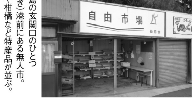
佐木島の玄関口のひょうろ(さき)港前には無人市。野菜や柑橘など特産品が並ぶ。