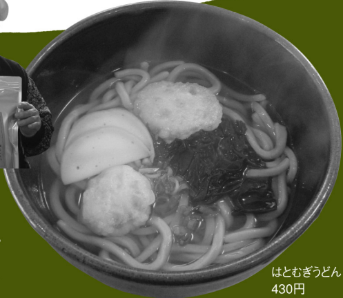
はとむぎうどん 430円