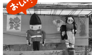
微笑ましい手づくり人形。今回は清盛と英国兵隊!?オリンピックイヤーならではのカップル。世羅町巴徳神社近くで。

●今回のみはらっせ初めて拝見しました。地元のおいしい物やわかりやすい地図が載っていて楽しませていただきました。次回も旬な情報やイベント、特産品、夏休み子供達も一緒に楽しめる情報なども含めて楽しい冊子になりますよう期待しております。 ◎丹井まき 34歳・広島県尾道市 ★夏休みもみはらっせ!