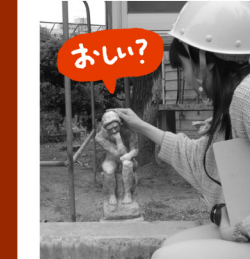
ホワイトセメントの工場内で発見! なんともちっちゃいロダン像が! ナデナデできる日がくるとは〜!

●普段何気なく通っていた道や場所の、未知の世界を教えてください。今回は新しく出来た「神明の里」特集で、初めて存在を知りました。糸崎は学生のころ電車に乗りいつも通り過