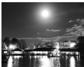
三景園から見る満月は素晴らしい