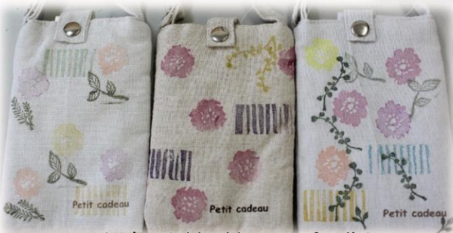
同じ図案でも思い思いの可愛い作品