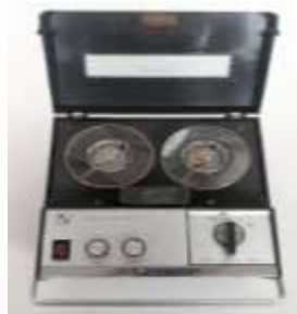
テープレコーダー