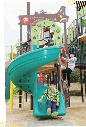
お友だちと仲良く あそぼうね~