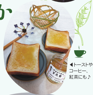
◀トーストや コーヒー、 紅茶にも♪