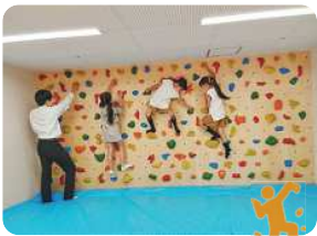
ボルダリングコーナー

道具を使わずに体一つで壁をよじ登る「ボルダリング」が体験できます。三原の海をイメージした貝やタコのボールド(取って)を設置!