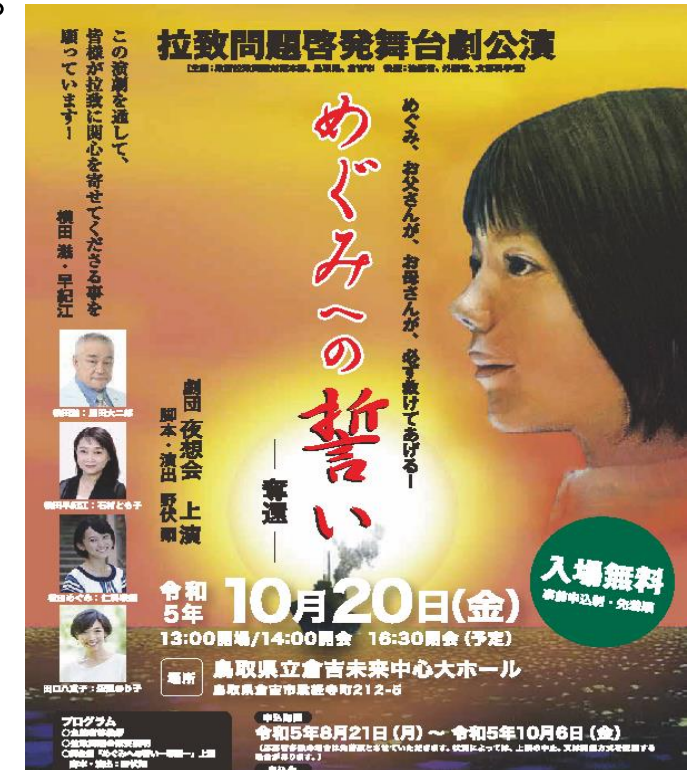
ポスター（イメージ）