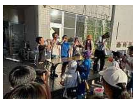
ラムネ早飲み大会