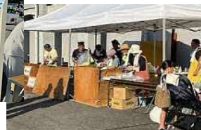
焼きそば・リング焼き