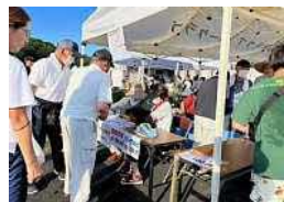
有料チケット売り場