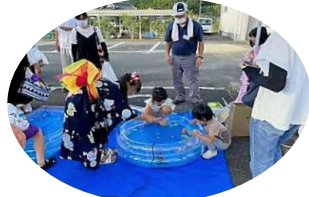
プラスチック金魚すくい