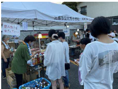
本郷地域支援員による ポップコーン販売