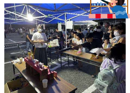
地元の小学生・中学生・PTA による子ども出店(射的他)