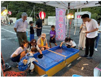
茅ノ市自治会の フィッシュファーム GACHI

久しぶりの通常開催だったこともあり、令和元年より来場者が増え、遠方から帰省した方も多かったように思います。子どもたちの笑顔に癒されました。