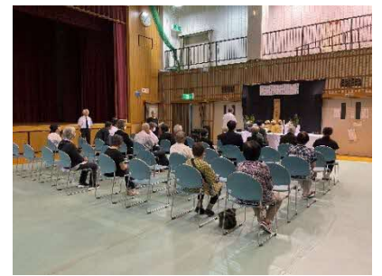
北方老人クラブ希望会による 慰霊祭