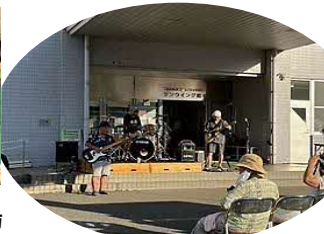
エレキバンド演奏