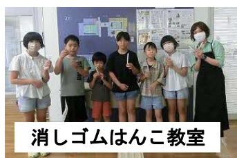
消しゴムはんこ教室