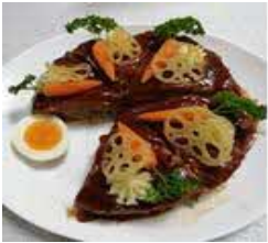
デコレーションケーキ風ハンバーグ

7月28日(金)に体験講座「いつもの料理をおもてなしに!」を行い、美味しく、華やかな時間を過ごしました。