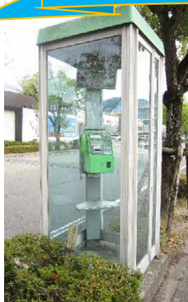
旧図書館前、並木通り沿いの公衆電話