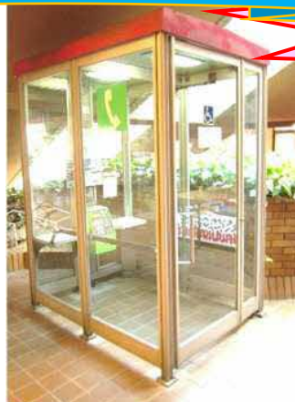
リージョンプラザの文化ホールに上がる階段裏にある車椅子対応の公衆電話

携帯電話の普及とともに激減した公衆電話。特にいつでも気軽に利用できる屋外公衆電話となると、中公界限...はて、どこにあったかな?