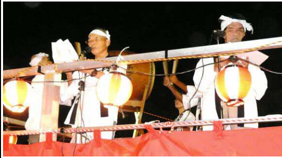
口説きに合わせて中之町の盆踊り