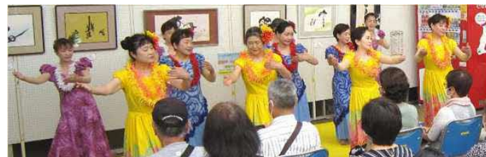
中央公民館作品展示・学習発表会(6/17 舞台発表の部)にて