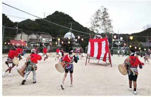
勇壮な深町の太鼓踊り

8月14日（月）中之町と深町で町内盆踊り大会が行われました。中之町は3年ぶり、深町は5年ぶりの開催です。主催はいずれもそれぞれの連合自治会（町内会）。