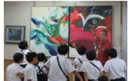
本郷西小学校の児童を迎えて