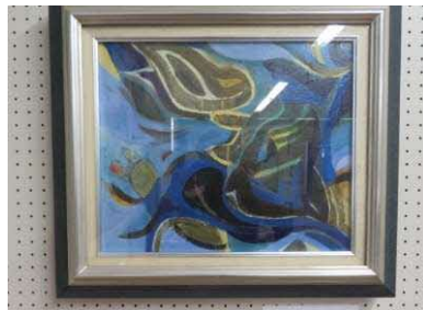
「ジジ逝くまぼろし」