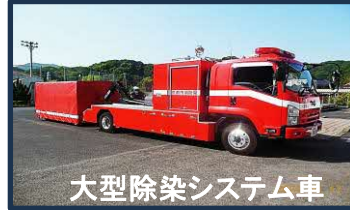
大型除染システム車