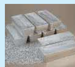
有用金属(銀)のイメージ