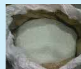
破碎・選別したガラス