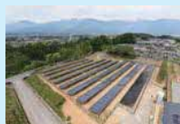
リユース品を使用した発電所