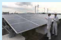
太陽発電設備の検査の様子

使用済みとなった太陽光パネルには、再販売可能なものもあり、既に多くのリユース事例が報告されています。