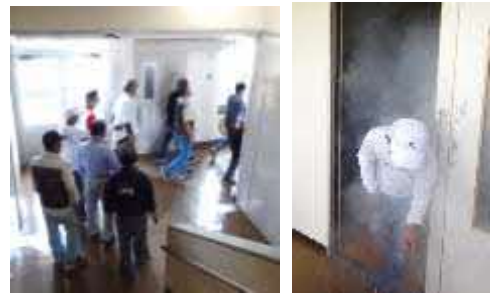
煙の中を通る避難訓練