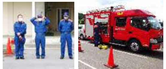
ご指導いただいた三原市消防署の皆さん