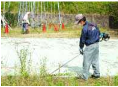
運営委員さんによる草刈り作業

6月24日(土)、利用者や運営委員の皆さんには、蒸し暑い中、熱心に作業していただきました。おかげでグラウンドやコミセン周りがとてもすっきり、さっぱりしました。