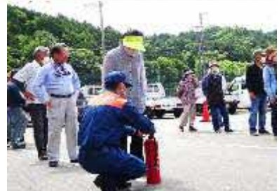
消火器での消火訓練