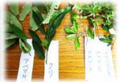
樹木の名前と特徴調べ