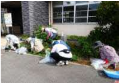
利用者の草取り作業