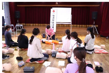
▲講習会のイメージ