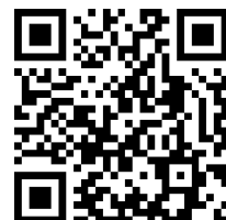
▲専用申し込みフォーム

専用申し込みフォームから申し込み または 三原市子育て支援課・児童館「ラフraf」に電話で申し込み