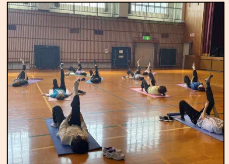
心もからだもスッキリ体操

まだ受講者の枠に余裕がありますので、受講希望の方は北方コミセン(TEL:0848-86-6237)の相談員までお問い合わせください。