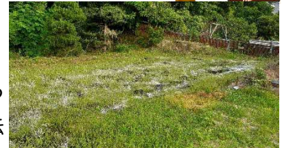
↑鷺浦小学校卒業生に貸す予定の畑