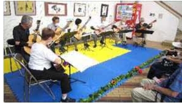
ギターアンサンブル'07