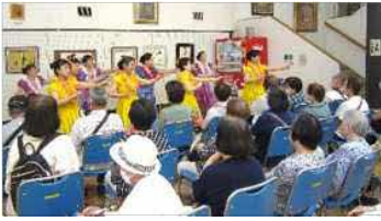
レイフワールアナ三原