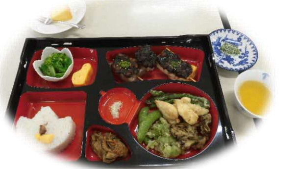
世界の家庭料理：日本料理(桜ご飯)