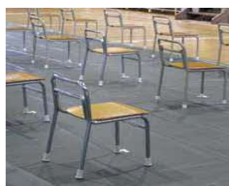
小1は、こんなに小さな椅子からのスタート。

こちらはワクワク・ドキドキの入学式。小さな身体を思い切り背伸びして、先輩たちの輪の中に入っていきます(^_^)♪