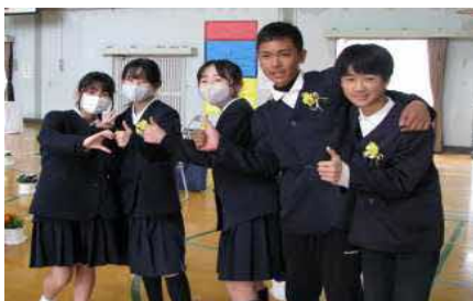
固い友情で結ばれた仲間たち（深小）

長年通った学び舎を後にする卒業式。お世話になった先生たちや友達と別れるのはちょっぴり悲しいけど、それぞれ少しずつ大人の仲間入り準備です。