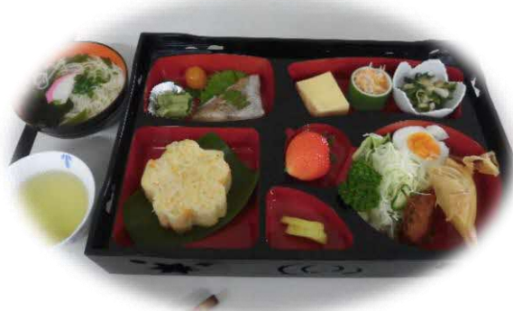
食の絆みはら：松花堂弁当

料理関係の自主講座では、4月限定のお花見弁当で春を楽しみました。旬の食材を使った普段よりもちょっと豪華な弁当で、お花見気分!桜を眺めながら、ゆったりと春を満喫することができました。