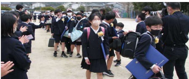
後輩たちの拍手に送られて卒業（中之町小）