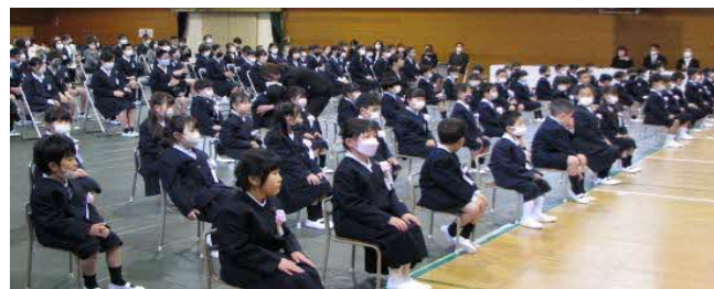
緊張しながらも、胸膨らませての入学式（中之町小）