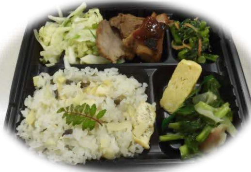
食養生講座：春の薬膳弁当