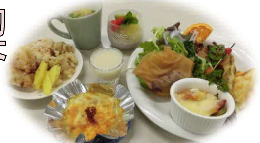
エコ教室：春のおもてなし料理