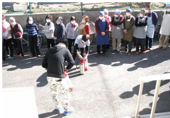
三原市消防団中之町分団のメンバーから消火器の操作指導を受けました。