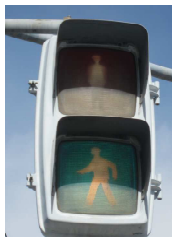
左上…曙橋車用(LED) 左下…曙橋歩行者用 右上…帝人通り車用 右下…帝人通り歩行者用 ※信号機のトリア LED 素子は 1 灯 192 個