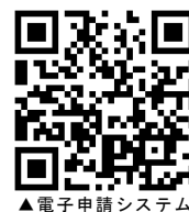
▲電子申請システム

URL : https://s-kantan.com/city-mihara-hiroshima-u/