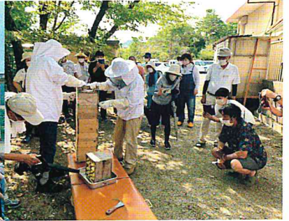
8月 日本ミツバチ採蜜教室