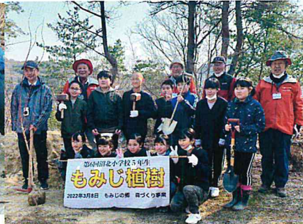
1月 森づくり事業 沼北小もみじの植樹