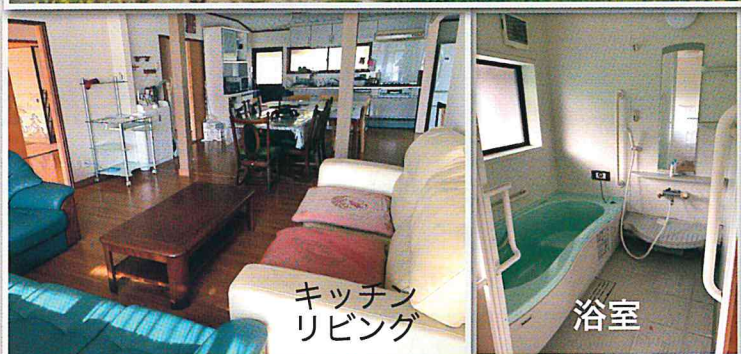
キッチン リビング