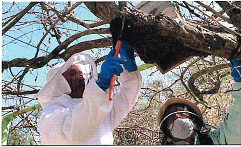
4月 日本ミツバチ分蜂群捕獲作業