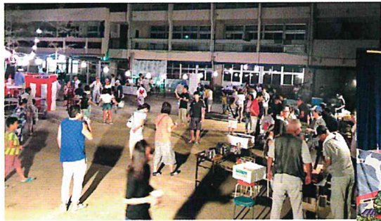
8月 合同慰霊祭 盆踊り大会