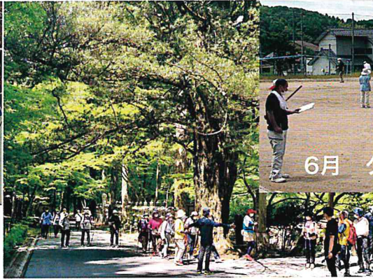
6月 グラウンドゴルフ大会