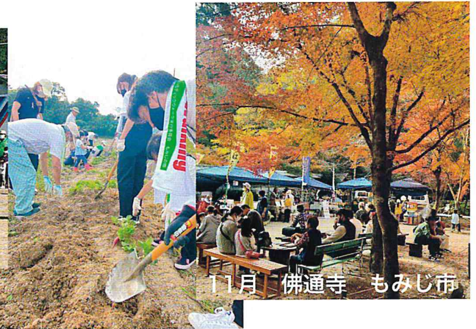
11月 佛通寺 もみじ市