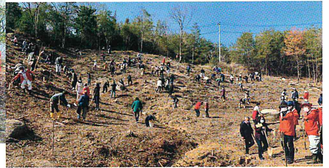
2月 森づくり事業 桜の植樹