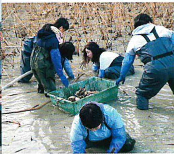
12月 れんこん堀 農業体験交流会