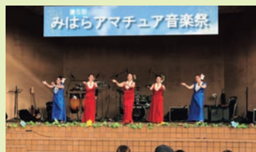
三原アマチュア音楽祭では、豪雨災害復興支援のたる募金も実施。