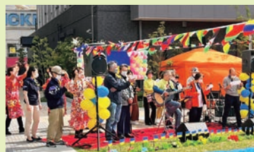
ウクライナ難民支援コンサートを開催。青黄のリボンは会員の手作り。

地域を盛り上げている人や、祭りなどの伝統行事を守り続けている人たちの思いを伝えます。