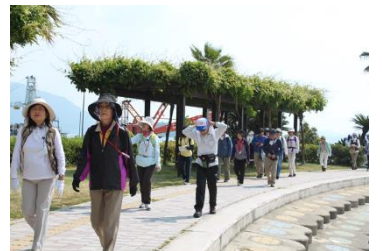
▲ウォーキングイベント