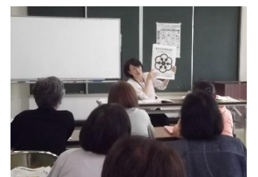
▲栄養士が食と健康づくりに関する講話を行います。