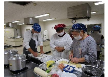
▲グループでバランスのよい献立を考案し調理実習を行います。