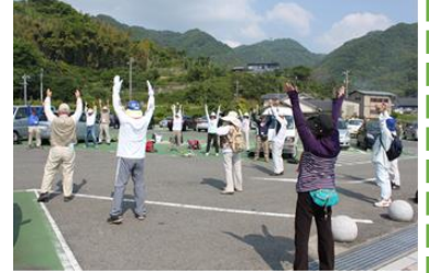
▲チャレンジ！ラジオ体操 & ウォーキング