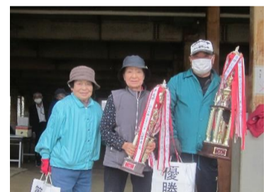
上: 優勝・準優勝・3位のみなさん