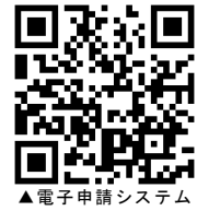
▲電子申請システム

URL : https://s-kantan.com/city-mihara-hiroshima-u/