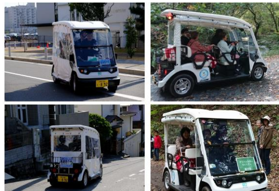
(グリスロのイメージ写真)